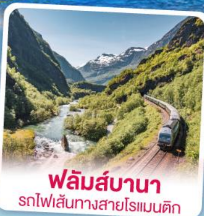
พลิမ်ส์บานา รถไฟเส้นทางสายโรแมนติก