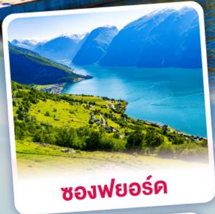
ช่องฟยอร์ด