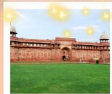
Ajmer Sharif Dargah