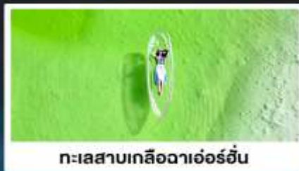
ทะเลสาบเกลือฉาเอ๋อร์อัน