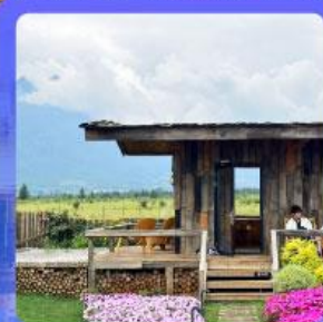
ร้านกาแฟหยุนตัน