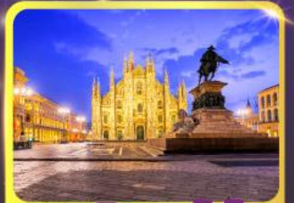
มหาวิหารคูโอโม