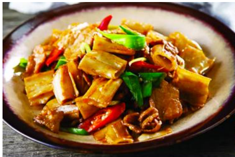
ถนนคนเดินเออร์ดอส

จากนั้นนำท่านเที่ยวชม อุทยานคังปาสื่อ 康巴什景区 เป็นเขตเมืองใหม่ที่ถูกเนรมิตรขึ้นและได้รับการขึ้นทะเบียนเป็นอุทยานท่องเที่ยวระดับ 4A และเป็นศูนย์กลางความเจริญของเมืองเออร์ดอส ประกอบด้วยจัตุรัส ธีม ปาร์ค พิพิธภัณฑ์ แกรนด์เธียร์เตอร์ ศูนย์วัฒนธรรม และสนามแข่งรถนานาชาติ นำท่านนั่งรถผ่านชมจัตุรัส รัฐบาล ทะเลสาบอุหลันมู่ สวนศิลปะงานปาติมากรรมเอเชีย ฯลฯ