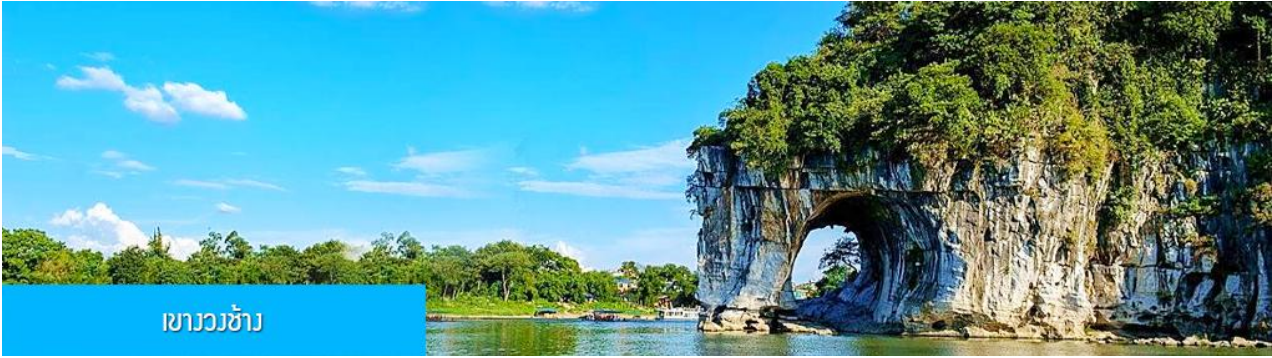
เขาวัวช้าง

รับประทานอาหารกลางวัน ณ ภัตตาคาร (มื้อที่ 7)