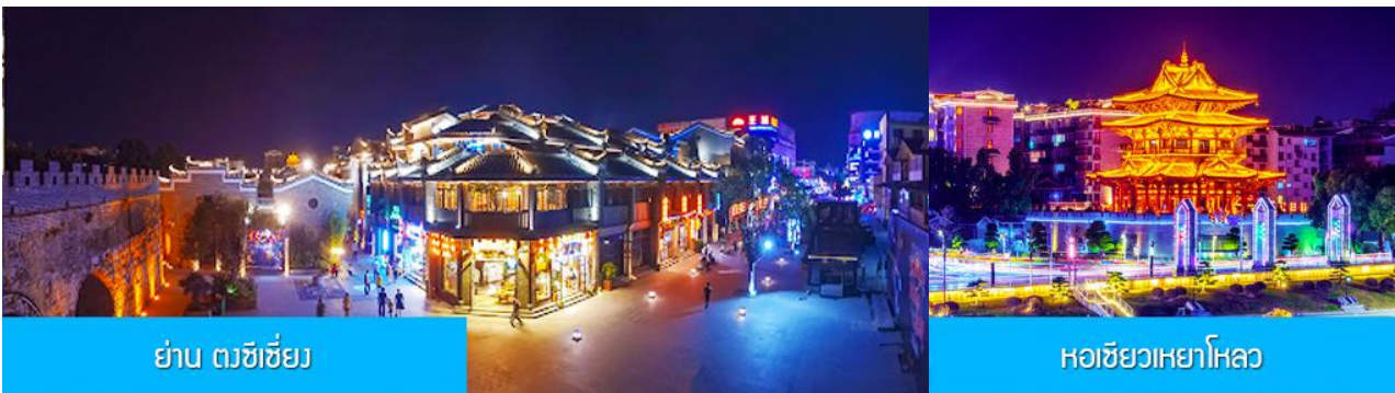
ย่าน ตงซีเจียง