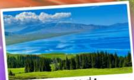
ทะเลสาบไซหลินู่

เที่ยวทุ่งหญ้าคอกฟ้า นาราตี ชมความสวยงามทะเลสาบไซหลินู่