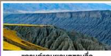
แกรนด์แคนยอนตูซานจื่อ