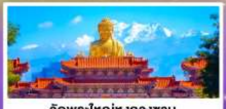
วัดพระใหญ่ทงกวงชาน