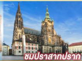
ชมปราสาทปราก