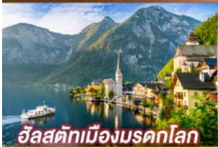
อัลสติกเมืองมรดกโลก