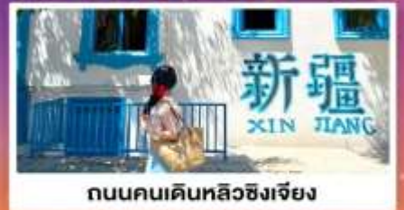
ถนนคนเดินหลิวซิงเจียง