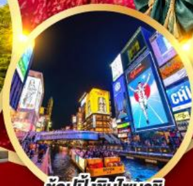
ช้อปปิ้งชินโซบาช