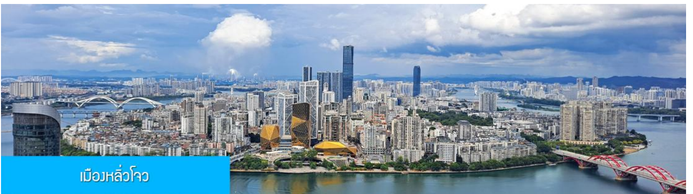
เมืองหลิวโจว

เช้า รับประทานอาหารเช้า ณ ห้องอาหารของโรงแรม (1)