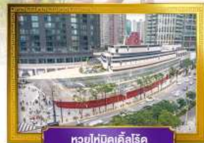
ทวยไห่บิคเคิลโรด