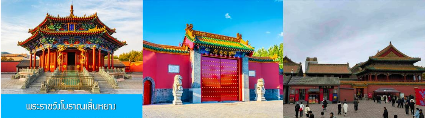
พระราชวังโบราณเสิ่นหยาง