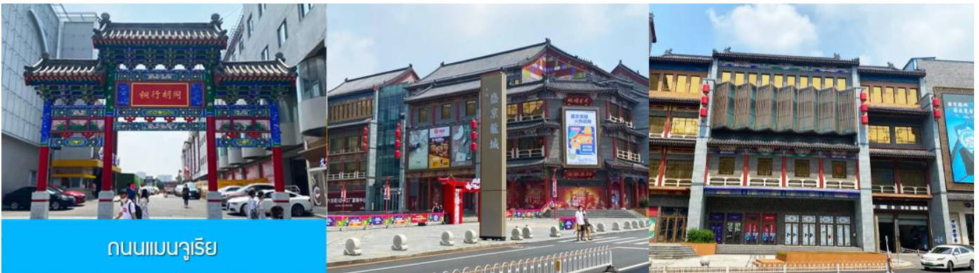
ถนนแมนจูเรีย