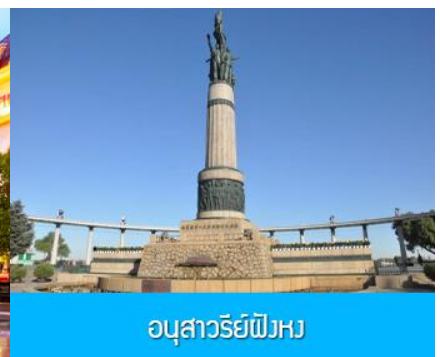
อนุสาวรีย์พิงหว