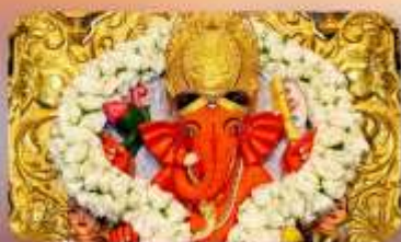
องค์สิทธิวินายัก