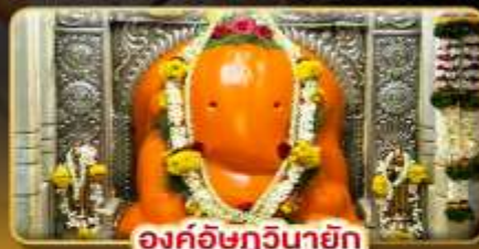
องค์อชฎวินายัก