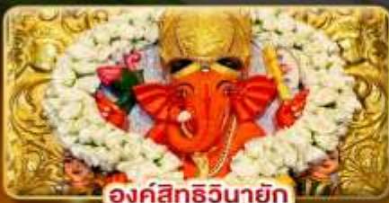
องค์สิทธินายัก