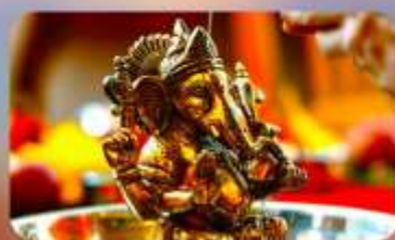
ร่วมพิธี Abhishekam