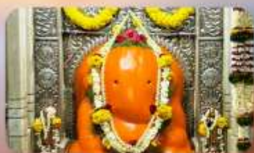
องค์อัยฎวินายัก