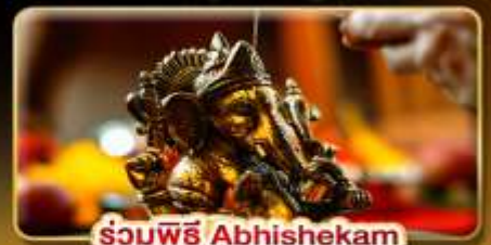
ร่วมพิธี Abhishekam