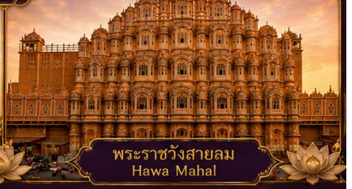
พระราชวังสายลม Hawa Mahal