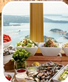
SKYFEAST BUFFET SYDNEY TOWER