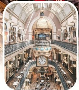
QUEEN VICTORIA BUILDING