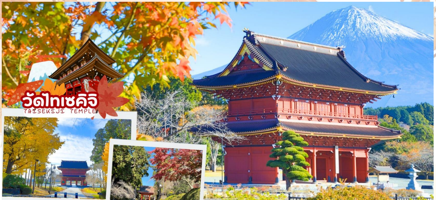
วัดไทเซคิจิ TAISEKIJJI TEMPLE

กลางวัน รับประทานอาหารกลางวัน ณ ร้านอาหาร (มื้อที่ 3)