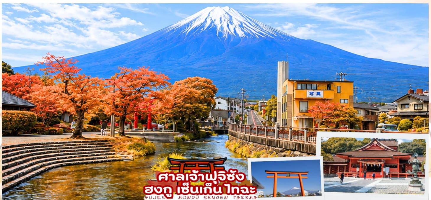
ศาลเจ้าฟูจิซัง ฮงกุ เซ็นเกิน ไทอะ FUJISAN HONGU SENGEN TAISHA

ศาลเจ้าฟูจิซัง ฮงกุ เซ็นเกิน ไทอะ (Fujisan Hongū Sengen Taisha) เป็นศาลเจ้าชินโต ตั้งอยู่ทางทิศตะวันตกเฉียงใต้ของฐานภูเขาไฟฟูจิ ในเมืองฟูจิโนะมิยะ จังหวัดชิซุโอกะ ครอบคลุมตั้งแต่ฐานภูเขาไฟฟูจิ ไปจนถึงยอดภูเขา ภายในศาลเจ้าเต็มไปด้วยความสงบ มีทั้งสถาปัตยกรรมแบบญี่ปุ่นโบราณ บ่อน้ำศักดิ์สิทธิ์ และวิวของภูเขาฟูจิที่งดงาม ศาลเจ้าแห่งนี้ตั้งอยู่ในตำแหน่งที่สามารถมองเห็นวิวภูเขาไฟฟูจิได้อย่างสวยงาม ด้วยบรรยากาศที่เงียบสงบและธรรมชาติรอบข้างสวยงาม ด้านหน้ามีน้ำไหลผ่านพร้อมกับเสาโทริสีแดง และภูเขาฟูจิ ทำให้ที่ศาลเจ้าแห่งนี้เป็นอีกหนึ่งจุดชมวิวภูเขาฟูจิและการถ่ายภาพที่สวยงามมาก