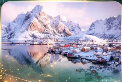
หมู่บ้านเรนเน