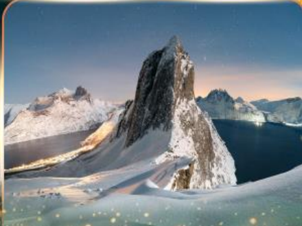
เกาะเซนญา