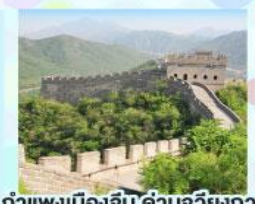
ตลาดร้อยปีเฉิงหวังเมี่ยว กำแพงเมืองจีน ด้านจวิยงทง