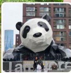
แพนด้าปิ่นตัก IFS