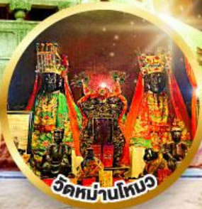
วัดบ้านใหม่ ขอพรเรื่องการศึกษา, การงาน สติปัญญาและความกล้าหาญ