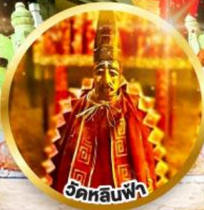
วัดลีนฟ้า ขอพรเสริมโชคลาภในธุรกิจ และการเงิน