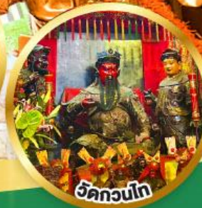
วัดกวนโก ขอพรเทพเจ้ากวนอู เงินทอง, ธุรกิจมั่นคง