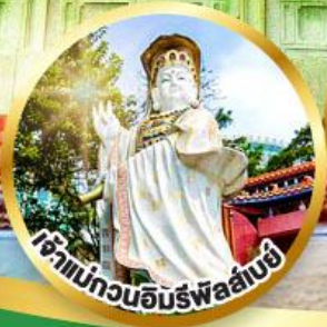
เจ้าแม่กวนอิมรพีลาลัย ขอพรรับพลังงานดี เสริมพลังดวงคู่