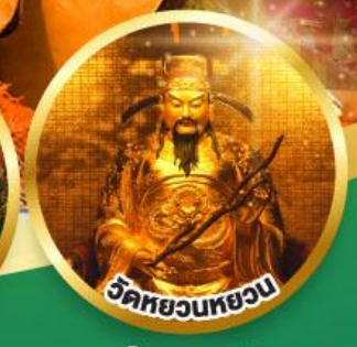
วัดหยวนหยวน ขอพรเรื่องสุขภาพ, โชคลาภ ความสำเร็จก้าวหน้า

เมนูพิเศษ! ต้มช้ำฮ่องกง, บุฟเฟ่ต์ชาบูสไตล์ฮ่องกง, ห่านย่าง