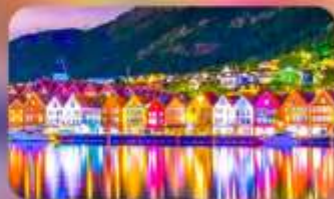
พักบอร์เกิน 1 คืน