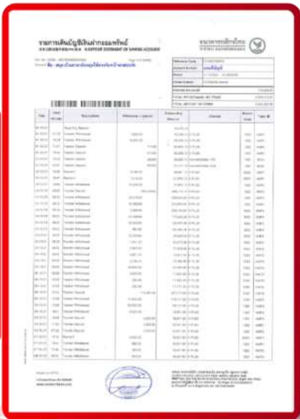
ตัวอย่าง Bank Statement ที่ผู้สมัครต้องยื่นกับธนาคาร

3.4 ปรับสมุดบัญชีธนาคารตัวจริง และเตรียมไปในวันที่ยื่นวีซ่า