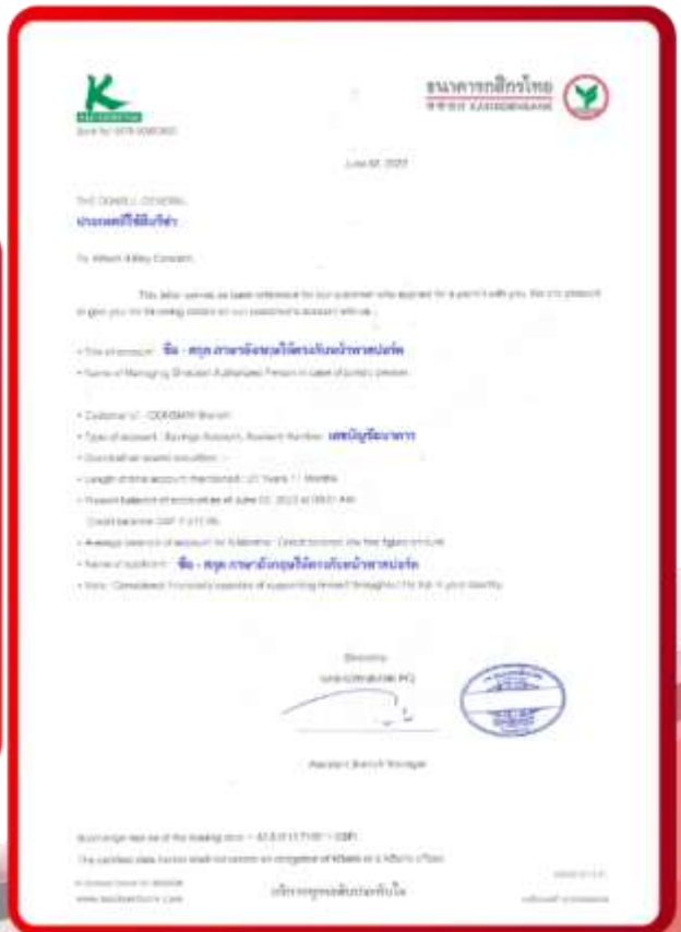
ตัวอย่าง Bank Guarantee ที่ผู้สมัครต้องยื่นกับธนาคาร